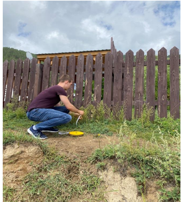
Фото 3,4 Озеро Байкал . Мониторинговая площадка в районе п. Блольшее Голоустное. обрушение берега