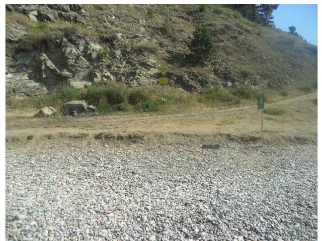
Фото 7. Озеро Байкал . Водоохранная зона в районе п. Листвянка. Аншлаги Прибайкальского национального парка. Баки для раздельного сбора ТКО