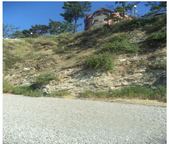
Фото 5,6 Озеро Байкал . Мониторинговая площадка в районе п. Листвянка