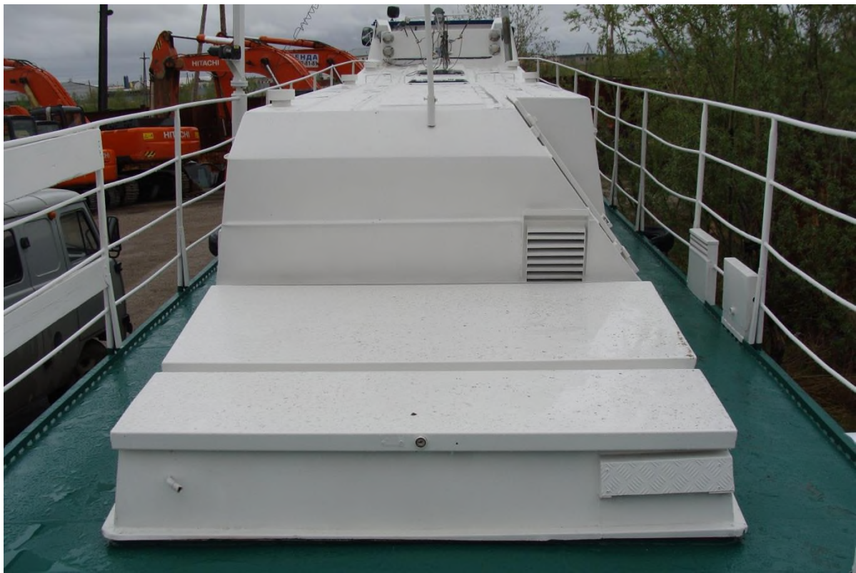
. Рисунок 7 На 28.05.2014г. покраска закончена.