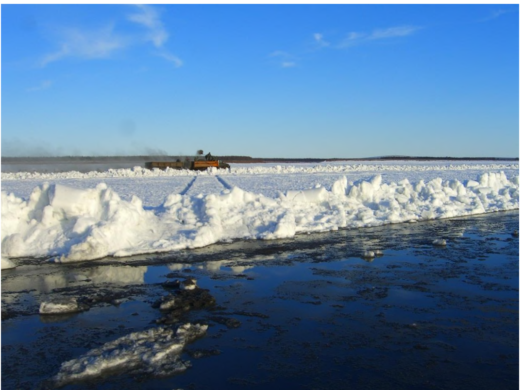
Рис.2 Идут работы по зачернению – общий план.