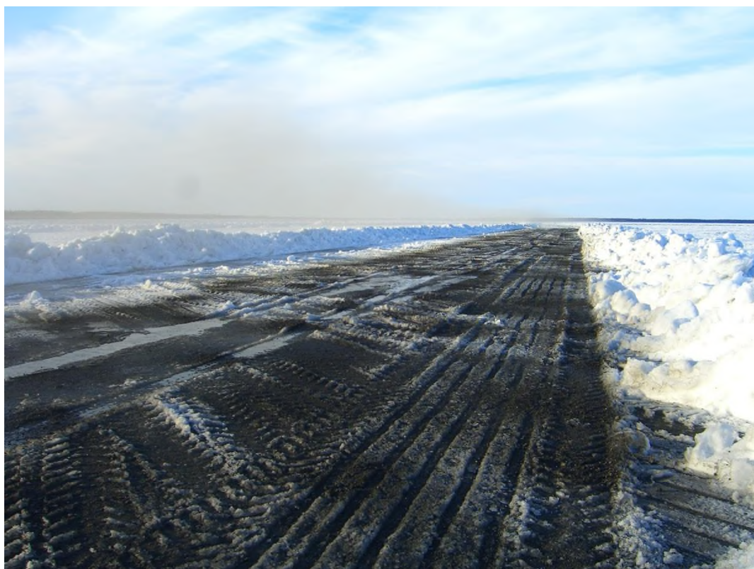
Рис.4 Зачерненная полоса