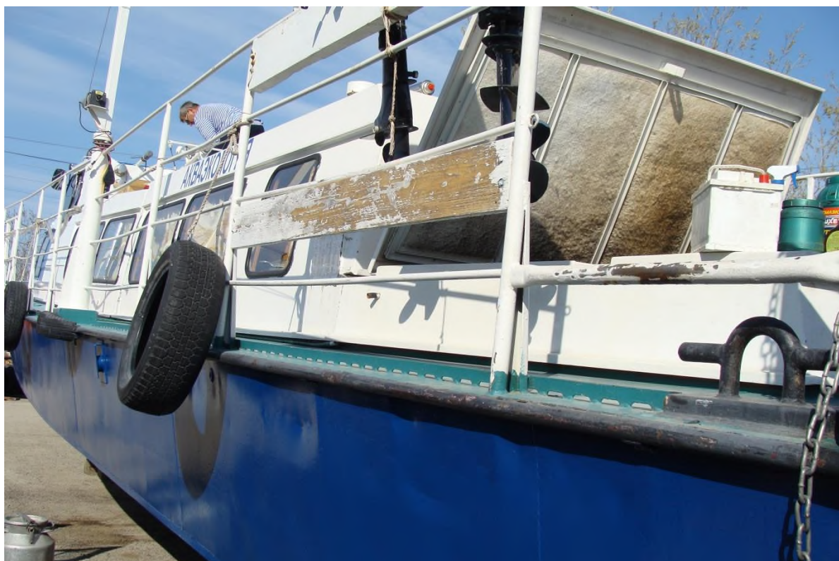
Рис.6 На 16.05.2014г. были покрашены днище, борта, шла покраска надстройки палубы.