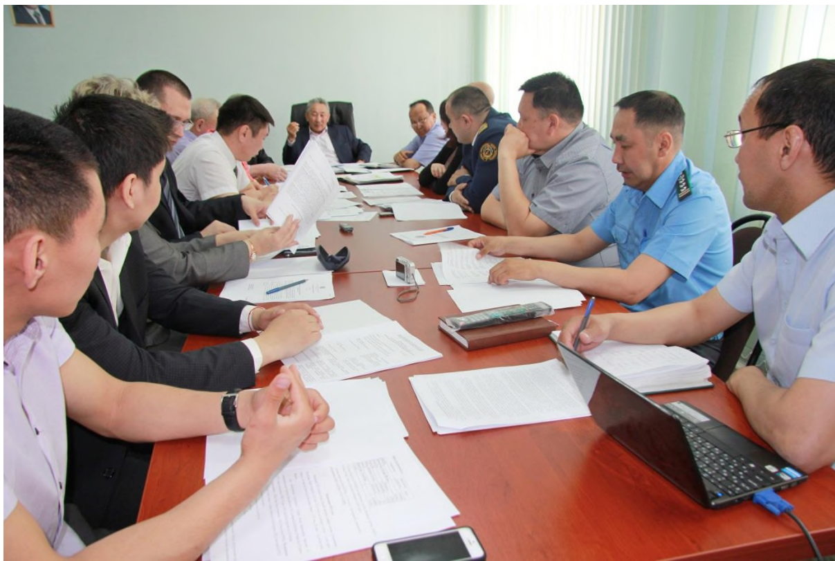
. Рисунок 8 Заседание МРГ от 27.05.2014г..