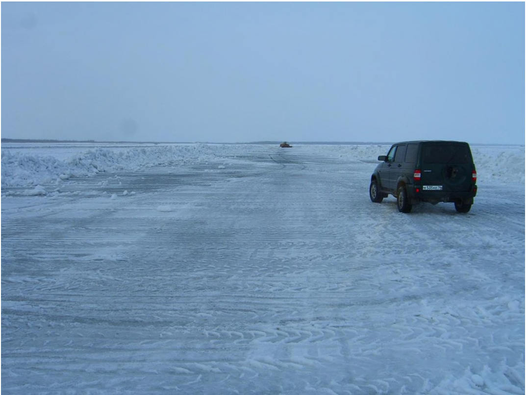
Рис.1 Очищенная от снега полоса зачернения