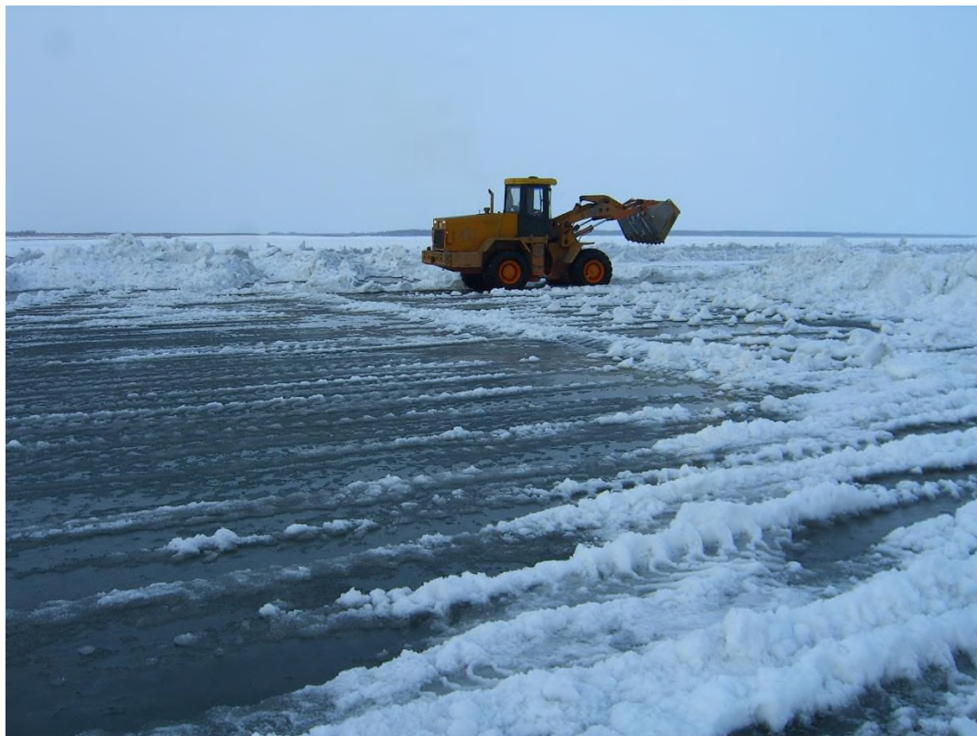
Рис.3 Погрузчик за работой